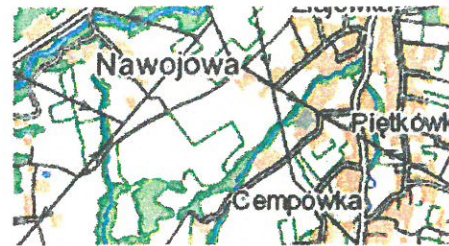
Szkic Orientacji Skala 1:25000