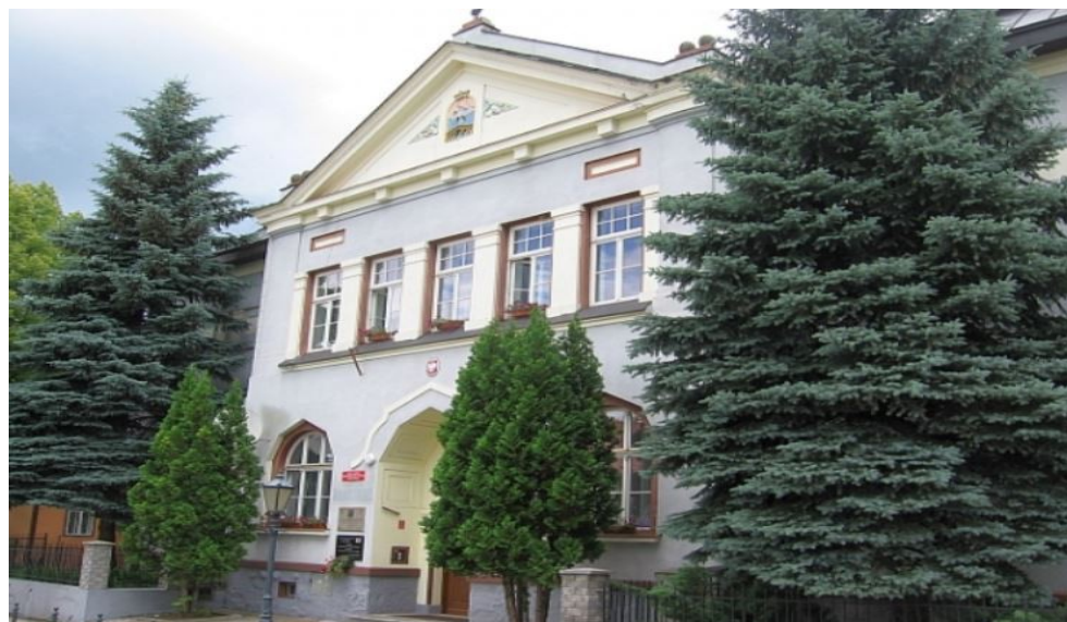
Zespół Szkół im. Ks. prof. Józefa Tischnera w Starym Sączu