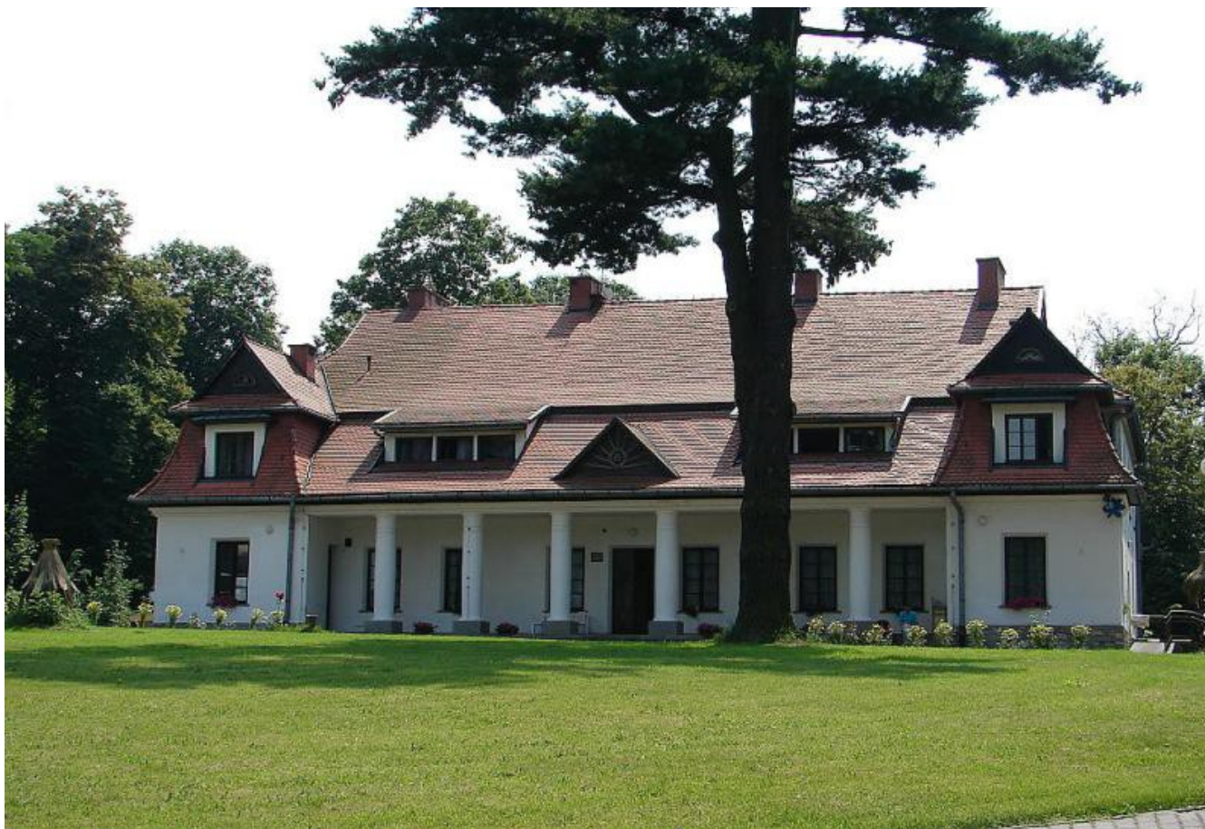
„Dwór” - Dom Pomocy Społecznej w Zbyszycach