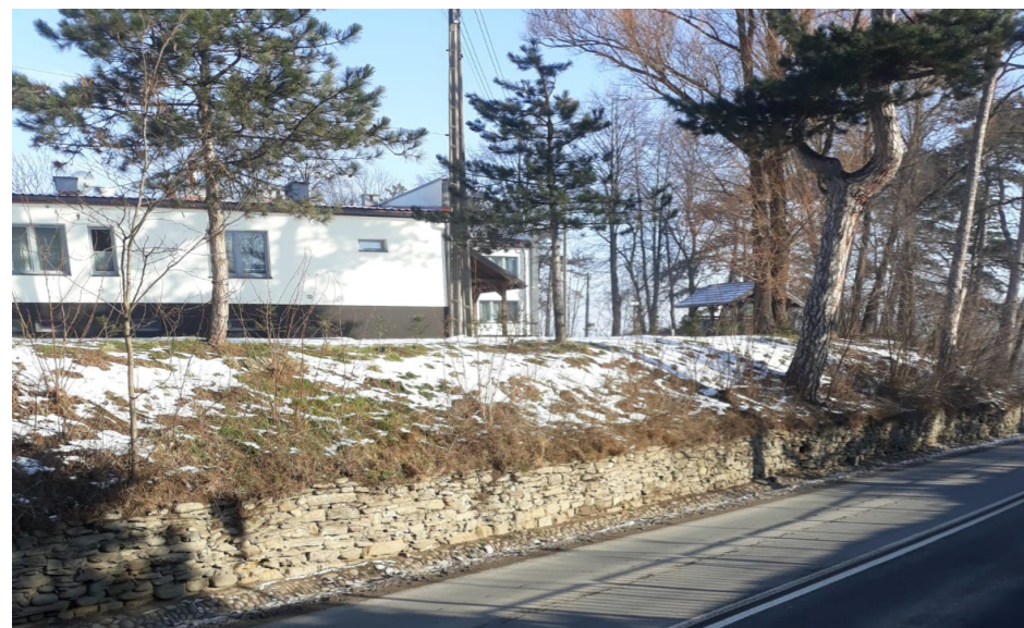
Kamienny mur oporowy skarpy staromiejskiej – Bursa Szkolna w Starym Sączu