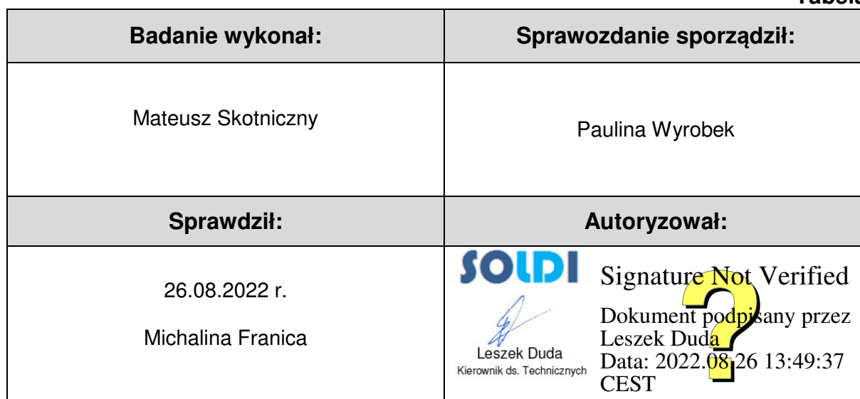
Tabela nr 6

Stwierdzenia zgodności dokonano na podstawie zasady podejmowania decyzji i wymagań zawartych w załączniku do Rozporządzenia Ministra Klimatu z dnia 17 lutego 2020 r. w sprawie sposobów sprawdzania dotrzymania dopuszczalnych poziomów pól elektromagnetycznych w środowisku [Dz. U. 2020, poz. 258, Dz. U. 2022, poz. 1121].