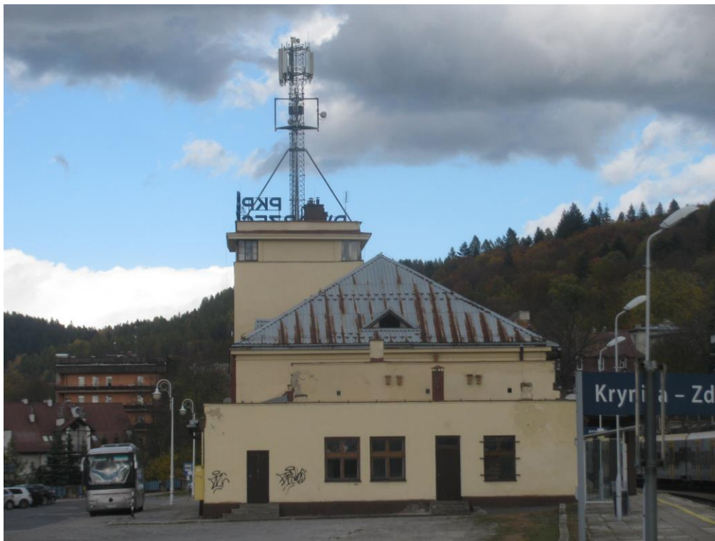
Zał. nr 1: Widok ogólny instalacji radiokomunikacyjnej.