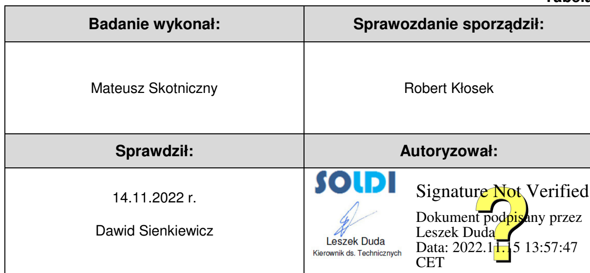
Tabela nr 6

Stwierdzenia zgodności dokonano na podstawie zasady podejmowania decyzji i wymagań zawartych w załączniku do Rozporządzenia Ministra Klimatu z dnia 17 lutego 2020 r. w sprawie sposobów sprawdzania dotrzymania dopuszczalnych poziomów pól elektromagnetycznych w środowisku [Dz. U. 2020, poz. 258, Dz. U. 2022, poz. 1121].