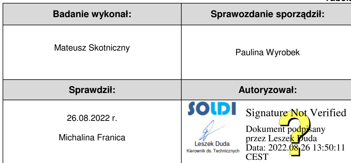
Tabela nr 6

Stwierdzenia zgodności dokonano na podstawie zasady podejmowania decyzji i wymagań zawartych w załączniku do Rozporządzenia Ministra Klimatu z dnia 17 lutego 2020 r. w sprawie sposobów sprawdzania dotrzymania dopuszczalnych poziomów pól elektromagnetycznych w środowisku [Dz. U. 2020, poz. 258, Dz. U. 2022, poz. 1121].