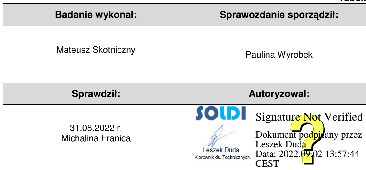
Tabela nr 6

Stwierdzenia zgodności dokonano na podstawie zasady podejmowania decyzji i wymagań zawartych w załączniku do Rozporządzenia Ministra Klimatu z dnia 17 lutego 2020 r. w sprawie sposobów sprawdzania dotrzymania dopuszczalnych poziomów pól elektromagnetycznych w środowisku [Dz. U. 2020, poz. 258, Dz. U. 2022, poz. 1121].