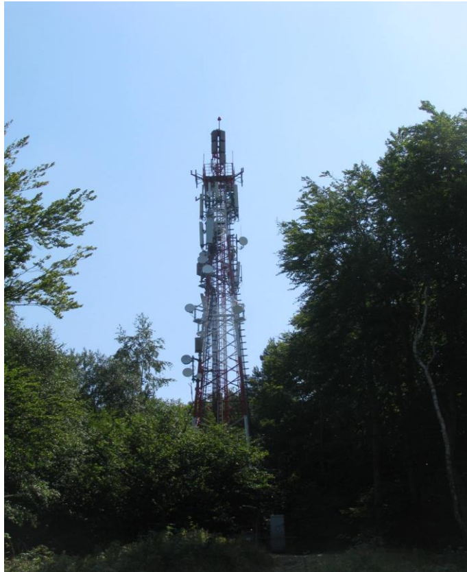
Zał. nr 1: Widok ogólny instalacji radiokomunikacyjnej.