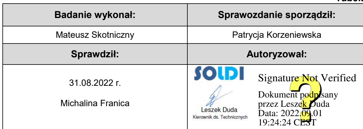
Tabela nr 6

Stwierdzenia zgodności dokonano na podstawie zasady podejmowania decyzji i wymagań zawartych w załączniku do Rozporządzenia Ministra Klimatu z dnia 17 lutego 2020 r. w sprawie sposobów sprawdzania dotrzymania dopuszczalnych poziomów pól elektromagnetycznych w środowisku [Dz. U. 2020, poz. 258, Dz. U. 2022, poz. 1121].