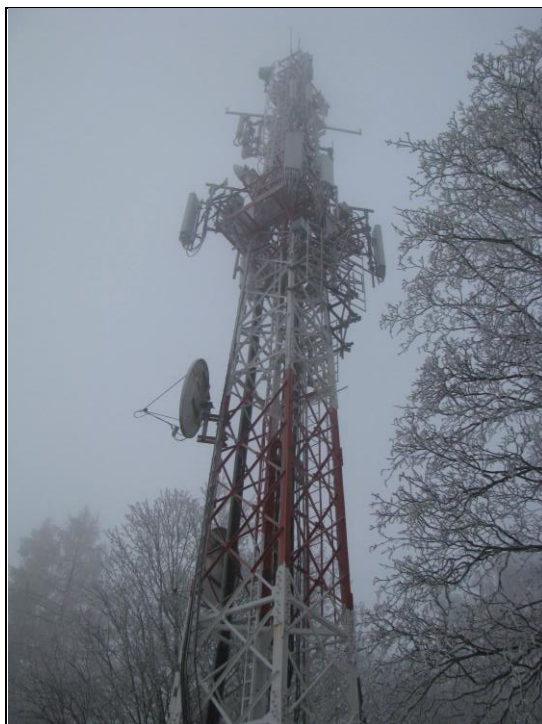
Zaf. nr 1: Widok ogólny instalacji radiokomunikacyjnej.